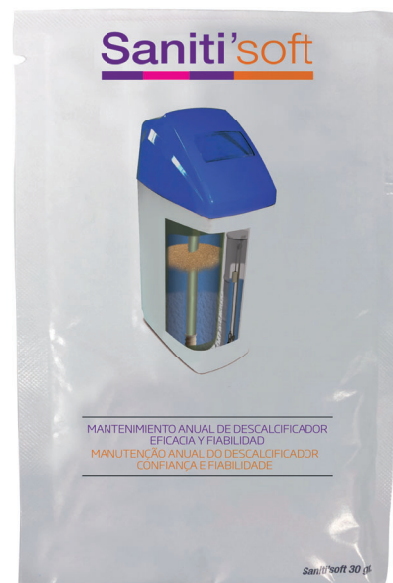
En blister de 6 sobres de 30 gramos

Aplice el contenido completo del sobre en el momento de realizar una carga completa de su depósito de sal: