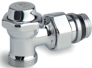
Mod. T29 C 1/2" x 16 Código: AC 71 025