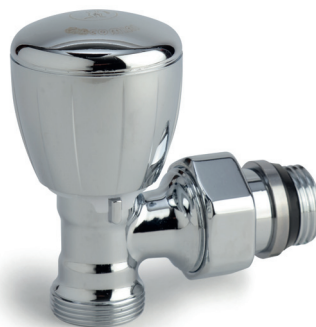
Mod. T431 C 1/2" x 16 Código: AC 71 017