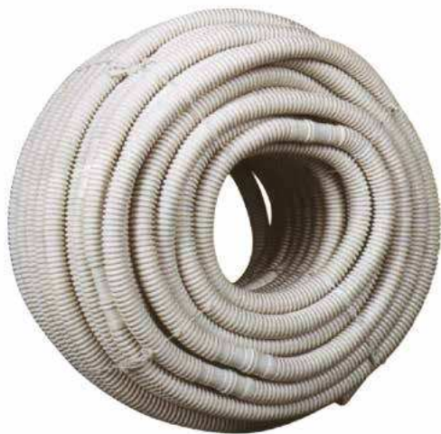
Cód. AS 04 138

Tubo de descarga de condensados corrugado anti ultra-violeta, en rollos de 50 metros con tramos de 0,5 metros macho/hembra, con el fin de facilitar su conexión a los sistemas de acondicionamiento de aire de splits